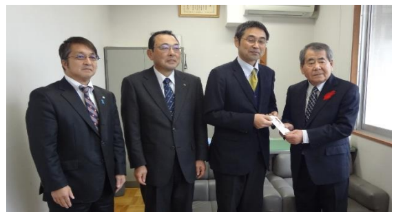
2016年活動・宮古社協へ贈呈の様子!